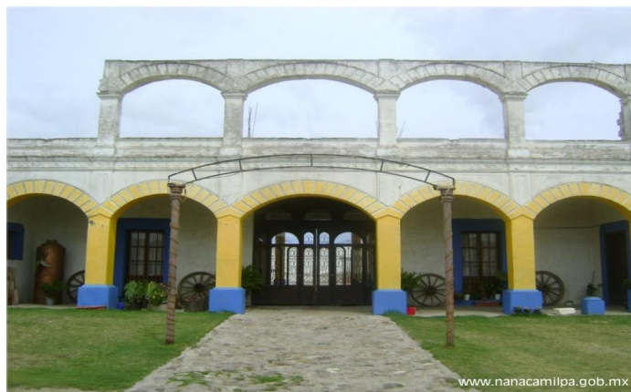
2.4.5.1 “San Cayetano”

Se localiza por brecha en el km. 6.5 al norponiente de Nanacamilpa. Es una hacienda del siglo XIX. La fachada es de aplanado, los muros de adobe y la cubierta de concreto. En una parte de la construcción se conserva el pórtico y restos de una arcada de medio punto ubicada en la parte superior. Posee una capilla edificada en honor a San Cayetano en el siglo XIX. Su fachada de color blanco y rojo está integrada de tres cuerpos. En el primero hay un arco ojival y una cornisa; en el segundo una ventana triangular y en el último está el remate que es un frontón. Conserva un pequeño atrio semicircular con portada de arco de medio punto y remate.