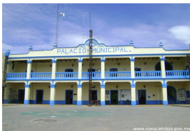
2.4.1.1 “Palacio Municipal”

Remodelada en 1943 para fungir como Palacio Municipal, el inmueble formó parte de la casa principal de la Hacienda y en el periodo de la revolución, sirvió como cuartel a las tropas principalmente del General Domingo Arenas.