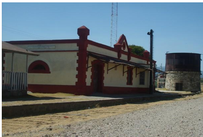
2.4.8.1 “Estación del Ferrocarril”

Estación del ferrocarril Interoceánico que estuvo en servicio de 1893 a 1999. Durante la revolución este fue un sitio estratégico en el que se dieron algunos acontecimientos históricos. Entre los años de 1930 y 1945 este sitio cobro mucha importancia por las actividades de embarque del pulque de la región, semillas y ganado. Actualmente, el INAH desarrolla el proyecto de instalar un museo con el tema del pulque.