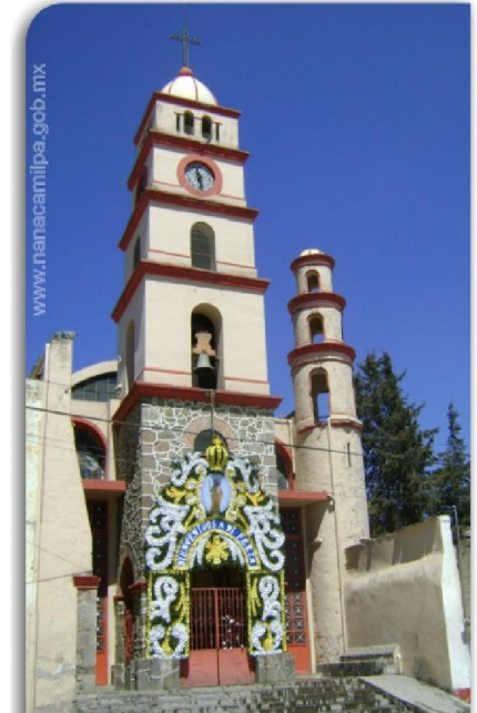
2.4.2.1 Parroquia de “San José Nanacamilpa”

El fundido de la campana se llevó a cabo con la colaboración de la gente de la comunidad, la característica que mas resalta en la parroquia es la luminosidad que la destaca de todas las demás. El edificio, conserva hasta la fecha parte del conjunto arquitectónico original.