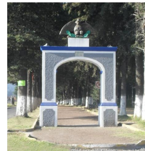
2.4.3.1 “El Águila”