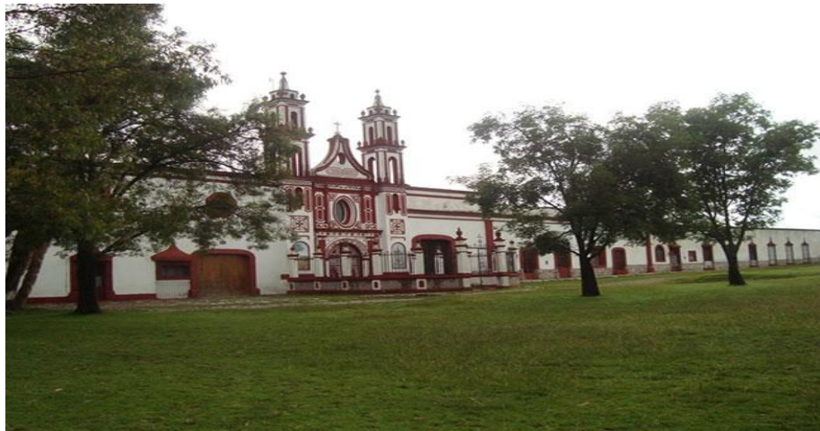
2.4.4.1 “Ex-Hacienda de Ixtafiyuca”

para el cultivo del maguey acabándose la producción del pulque, paulatinamente se transformó para recibir huéspedes y así poder mantenerla. En 2009, la Sociedad Defensora del Tesoro Artístico de México, le otorgó un reconocimiento por su labor de rescate y de conservación.