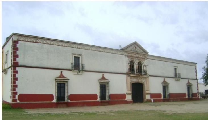
2.4.6.1 "Santa Cruz Tepozontitla"

Al centro un orificio orbicular, el frontón está adornado de varios motivos. Hay dos balcones más en el segundo cuerpo, uno a cada lado, éstos presentan una basa y herrería con puertas rectangulares. Rematan adornos y una cornisa tableteada a lo largo de la portada. En la parte posterior de la fachada que da al patio interior hay dos grandes arcadas: una inferior y otra superior.