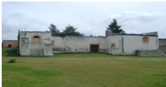
2.4.7.1 “La Calera”