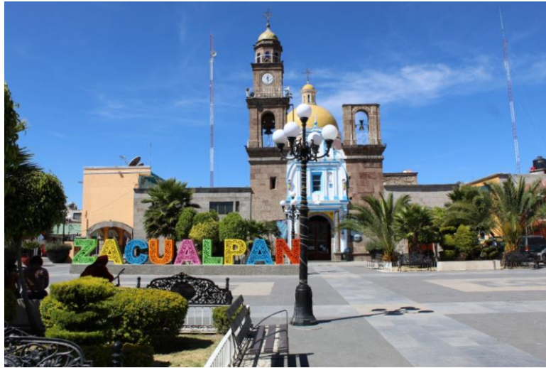
Plaza principal de San Jerónimo Zacualpan

Localizado al sur del estado, el municipio de San Jerónimo Zacualpan colinda al norte con el municipio de Tlaxcala, al sur colinda con el municipio de San Juan Huactzinco, al oriente se establecen linderos con el municipio de Tepeyanco, así mismo al poniente colinda con el municipio de Tetlatlahuca.