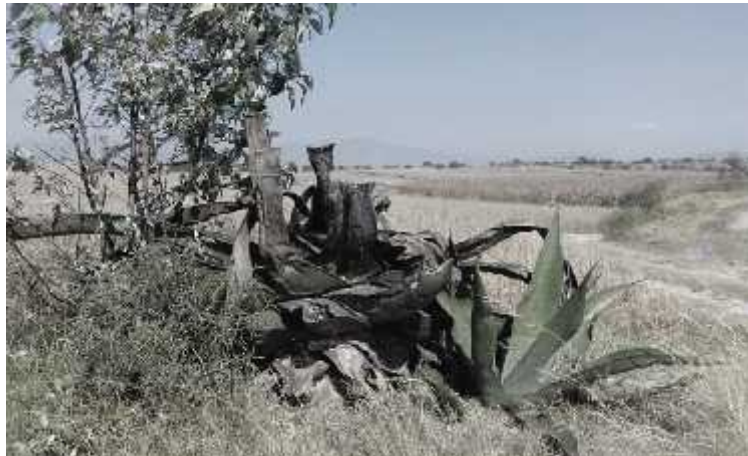
El maguey se está extinguiendo en los ejidos del municipio.

En cuanto a la calidad del suelo, para uso agrícola, este es en términos generales de regular calidad, teniendo sus particularidades en algunas comunidades , en donde por su relieve, su composición geológica, clima y precipitación pluvial y condición atmosférica y el propio trabajo de los productores, los hacen de mejores condiciones, sin embargo observamos que a últimas fechas los suelos se están erosionando, esto a consecuencia de la desaparición progresiva de barreras vivas (maguey, nopal y árbol) y barreras muertas (se realiza poco el terraceo, bordeo y zanjeo) y que trae como consecuencia que los suelos se erosionen, se pierdan y aflore el tepetate y pierdan sus propiedades orgánicas que los hagan fértiles.