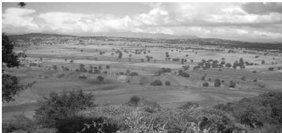
La tala inmoderada ha provocado que los bosques en Hueyotlipan se vayan extinguiendo.

Hoy día, podemos afirmar que en el municipio de Hueyotlipan existen muy pocos bosques y una gran superficie, incluso sin vegetación. Según información del Anuario Estadístico 2013, la cantidad de árboles existentes en el municipio era de 227,214.