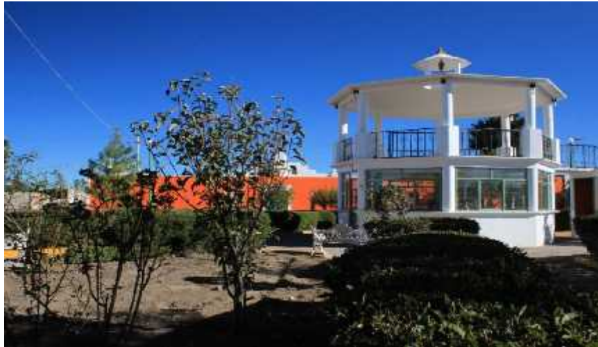
Parque de Ignacio Zaragoza