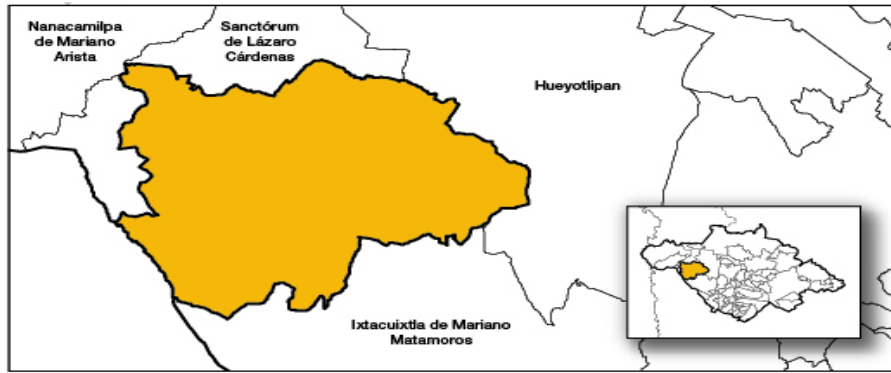
NOTA: Imagen 1 Se muestra área geográfica (INEGI 2020)